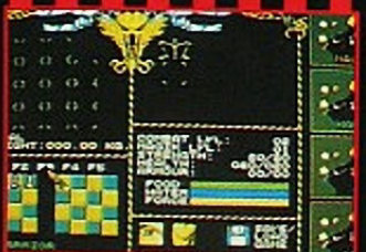
Screen shots taken from Amiga and Atari ST computer formats.

Shadowlands - the story is based upon ancient legend. A warrior prince, slaughtered on the battlefield of the Shadowlands, awakes to find that his spirit lives on and that he can control the minds and actions of his subjects. Seeking retribution, he chooses four loyal adventurers and guides them back into the Shadowlands on a journey of discovery and vengeance.